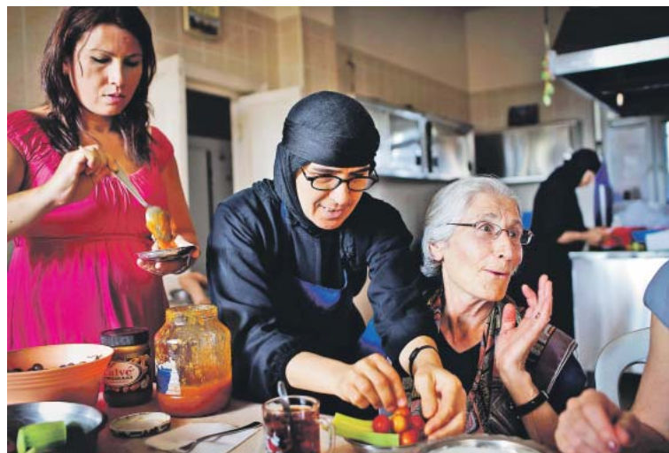
Frühstück im Trakt der Nonnen: Viele Assyrer in der Diaspora besuchen so oft wie möglich das Kloster.

Das syrisch-orthodoxe Kloster Mor Gabriel in der Türkei ist eines der ältesten Klöster weltweit. Dennoch müssen die Mönche seit Jahren ihren Grundbesitz vor Gericht verteidigen. Was als Nachbarschaftsstreit begann, hat sich zu einem ernststen Konflikt verfestigt. Sein Ausgang wird viel darüber aussagen, wie Ankara tatsächlich zu der christlichen Minderheit im Land steht.