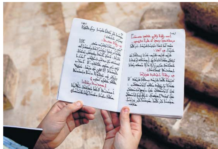
Ein aramäisches Gebetsbuch: Während der Schulferien reisen Jugendliche aus aller Welt an, um die Sprache Jesu zu lernen.