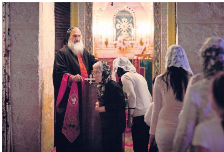
„In Europa kann man sich nicht vorstellen, was es bedeutet, als Christ hier zu leben“: Bischof Timotheos bei der Messe.